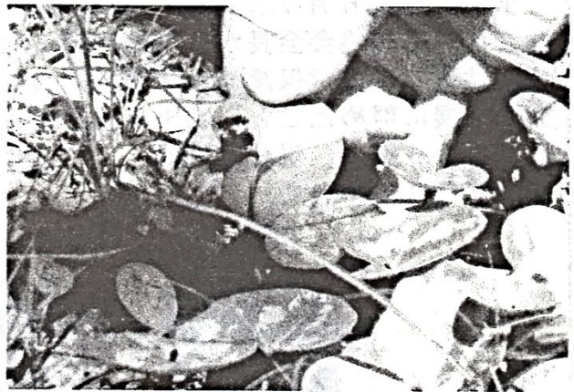
ヒメカンアオイ葉裏の幼虫と卵（白い点）