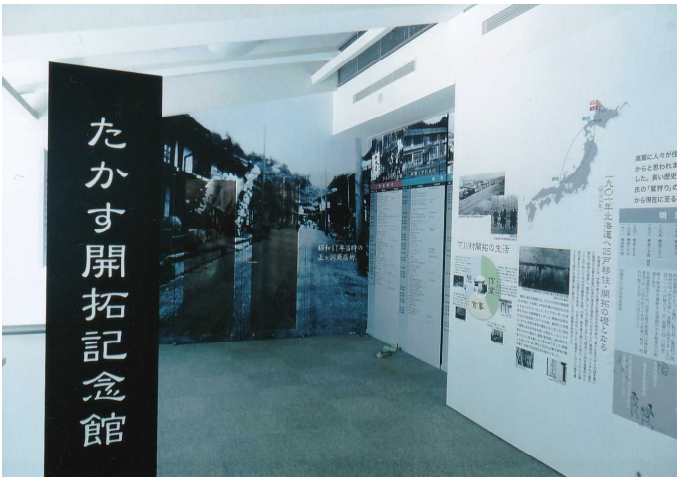
たかす開拓記念館入り口付近(年表と昭和11年当時の正ヶ洞の町並み)

協会会長をはじめ町内自治会長の皆さんなど約100名余の参加を得て、厳かの中にも華やかな儀式が執り行われて、「たかす開拓記念館」が開館した。3時30分から一般にも開放され、多数の入場者があった。なお、高鷲町文化財保護協会は、開館に当たり郡上市長から感謝状を頂いたことを報告します。