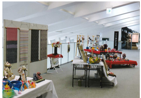
わくわくギャラリークラフト展

「たかす開拓記念館」の開館を盛り上げるために町民の有志が「わくわくギャラリークラフト展」をギャラリー「ホアイエ」で開催しています。本協会もこれを後援し、成功を願うものであります。5月27日まで開催していますので、クラフト展も見に来てください。